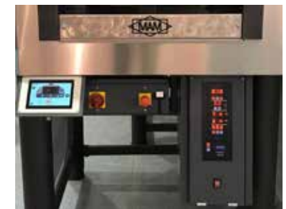
Rotazione forno controllata da pannello Touch Screen.